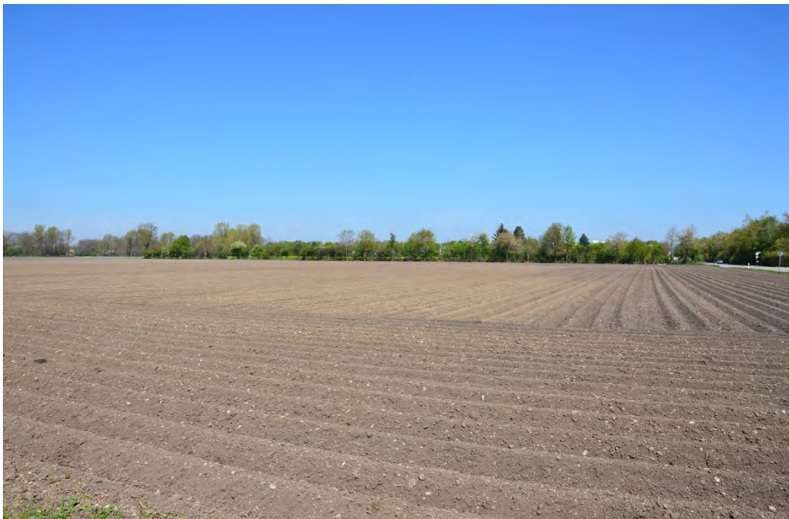
Blick von Süden auf das Plangebiet.

Die vorhandene Gehölzhecke an der Südgrenze des Plangebiets schirmt die Fläche bereits gut ab.