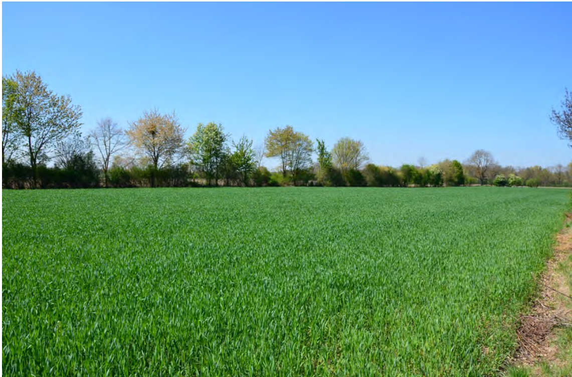
Blick auf die Gehölzhecke an der Südgrenze des Plangebiets