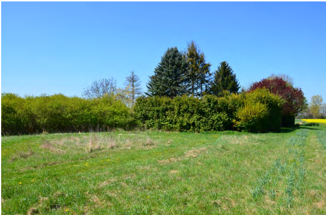
Freizeitgrundstücke mit vorwiegend gebietsfremder Bepflanzung