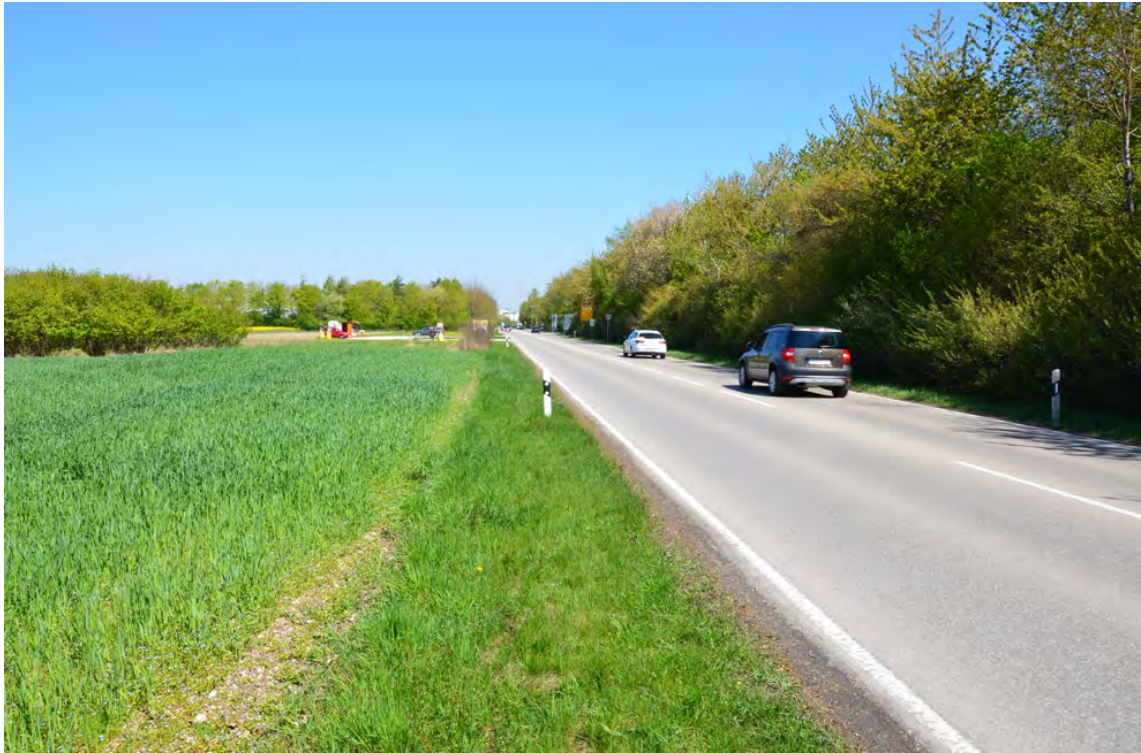
Die Landshuter Straße im Osten des Plangebiets. Rechts die dichte Gehölzhecke mit Lärmschutzwall