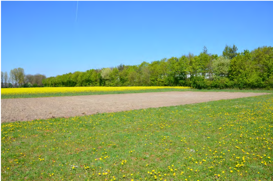
Blick über das Plangebiet nach Nordwesten: Die Gehölzhecke an der Nordgrenze des Plangebiets liegt im Geltungsbereich des Bebauungsplans Nr. 151