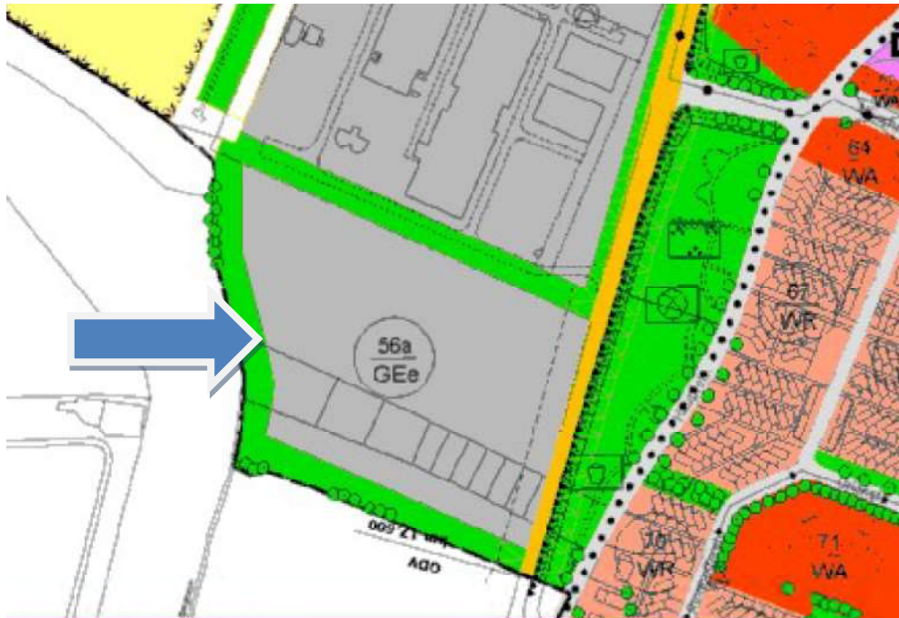
Abb. 1: Ausschnitt aus dem Flächennutzungsplan der Stadt Unterschleißheim

Im Regionalplan München wird das Planungsgebiet als Fläche für Gewerbeansiedlung dargestellt. Das Trenngrün wird von der Planung nicht tangiert.