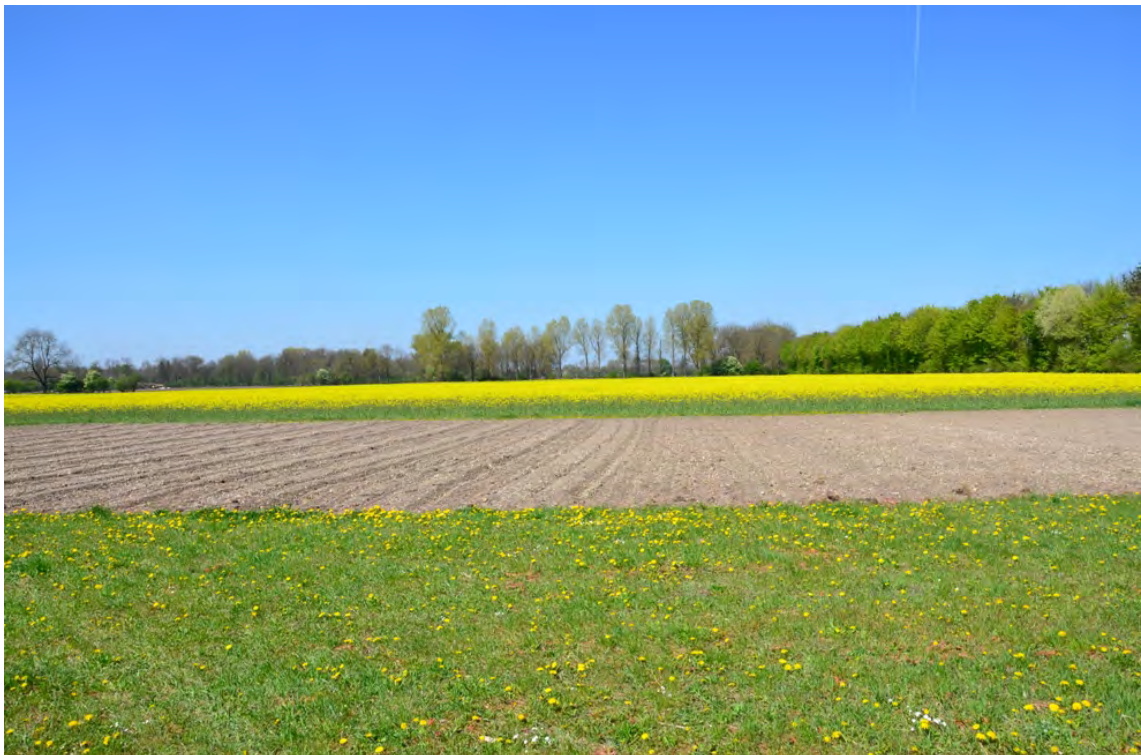
Blick über das Plangebiet nach Westen: Im Hintergrund die Bäume auf der westlichen Grenze des Plangebiets